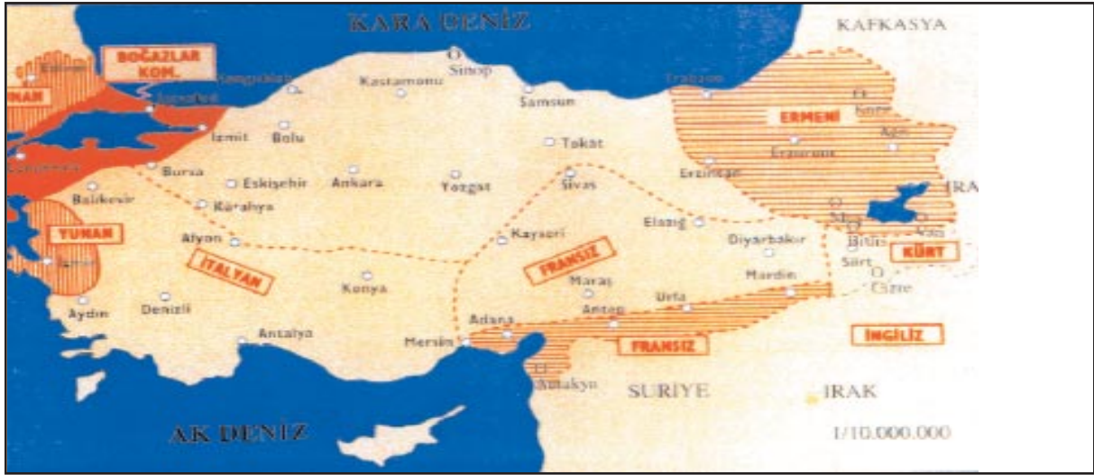
Sevr Antlaşmasına göre Türkiye'nin taksimi (10 Ağustos 1920)

İkinci safhada, bir taraftan Batılı Emperyalist Devletler, öbür yandan Ruslar, Kürtleri ve tabii diğer